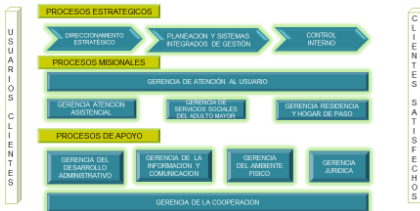
MAPA DE PROCESOS

E.S.E. HOSPITAL GERIÁTRICO Y ANCIANATO SAN MIGUEL