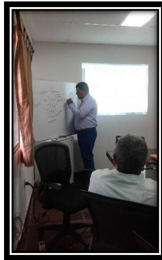
INSTRUCTOR CONTRALORIA MUNICIPAL