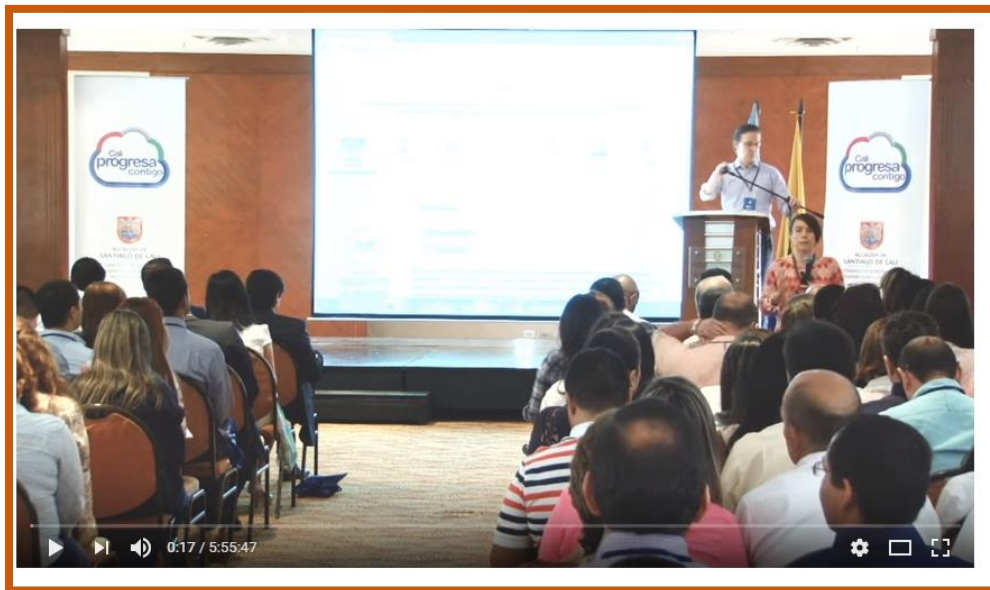
SEMINARIO TALLER CAPACITACION DAFP Y ALCALDIA DE CALI NOVIEMBRE 2017