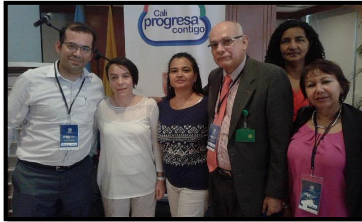
FUNCIONARIOS DEL DAFP INSTRUCTORES DEL SEMINARIO