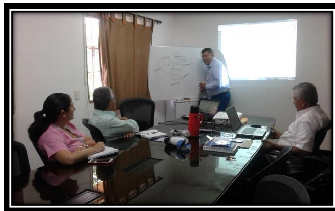
CAPACITACION MIPG AUDITORIO CENTRAL HGYASM